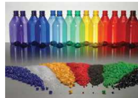
industria materialelor plastice