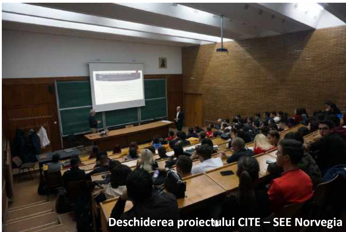
Deschiderea proiectului CITE – SEE Norvegia